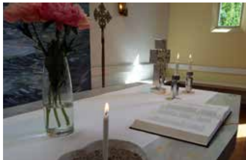
Altaret i Sävja kyrka