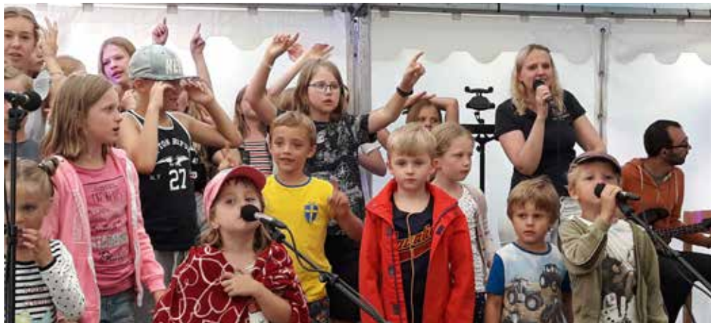
Barnkören sjunger på Åkerölägret.