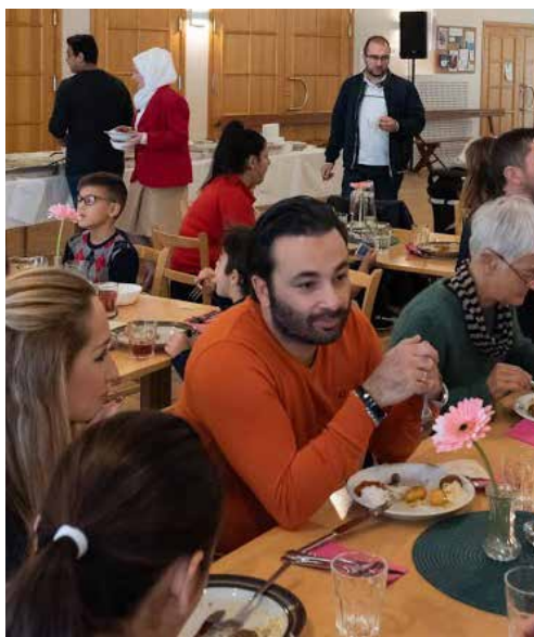
Det var stor gemenskap runt borden och den libanesiska maten uppskattades.

Lötenkyrkan än en gång fått vara en växtplats för liv. Denna gång med betoning på möten över gränser av t ex språk, tro, ålder och matfavoriter.