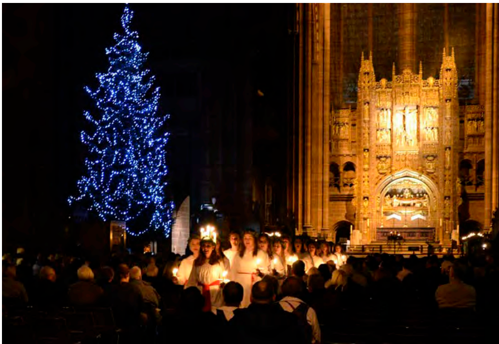
Lötenkyrkans ungdomskörs sång fyllde valven i den stora katedralen i Liverpool.